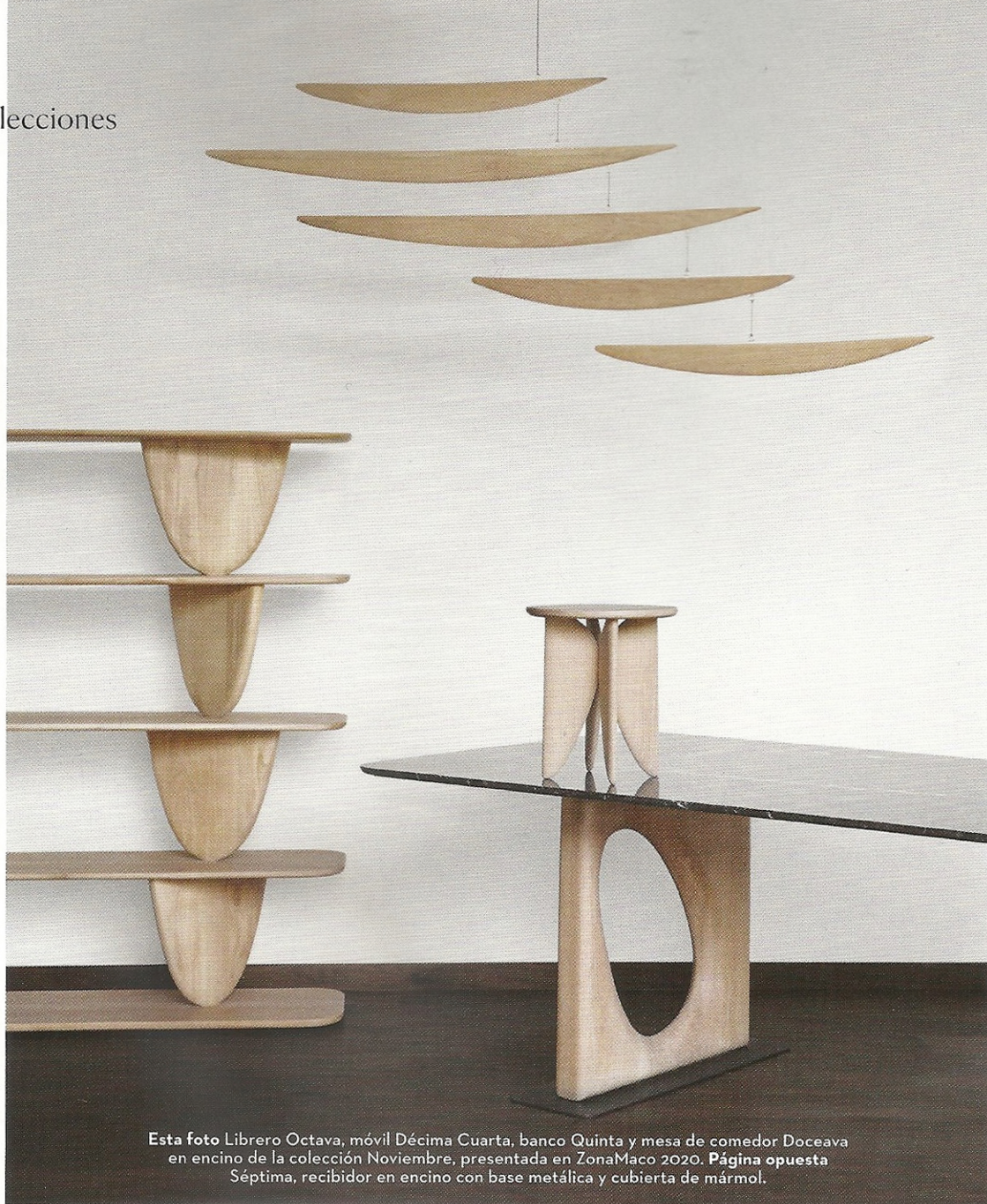
Esta foto Librero Octava, móvil Décima Cuarta, banco Quinta y mesa de comedor Doceava en encino de la colección Noviembre, presentada en ZonaMaco 2020. Página opuesta Séptima, recibidor en encino con base metálica y cubierta de mármol.