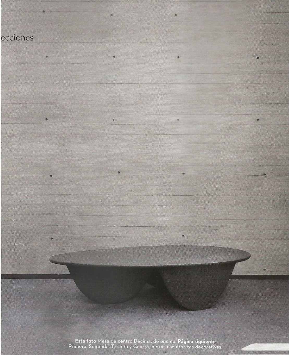
Esta foto Mesa de centro Décima, de encino. Página siguiente Primera, Segunda, Tercera y Cuarta, piezas escultóricas decorativas.

la colección nacida bajo estos ideales— invita a experimentar trazos y composiciones cálidos y serenos. La antología comparte objetos que utilizan la belleza como promesa de felicidad, e impulsan a pensar en la verdadera esencia de las cosas.